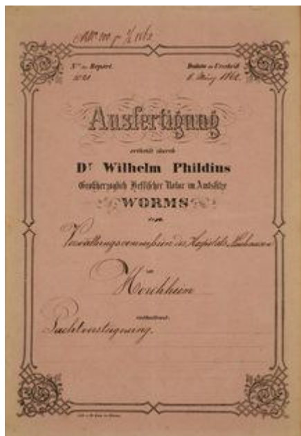
Die Ausfertigung einer Pachtversteigerung