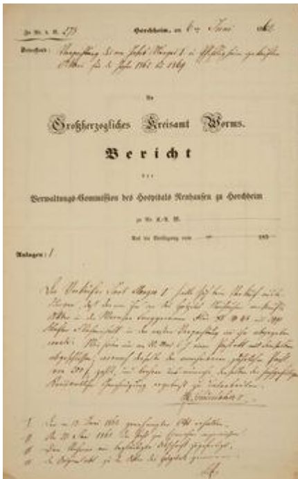
Dokument der Hospitalstiftung Neuhausen zu Horchheim

Wenig bekannt ist in Worms, dass sich im Stadtteil Horchheim der Sitz einer traditionsreichen Stiftung befindet, die seit 1729 karitative Funktionen erfüllt. Auf der Basis von Grundbesitz in Orten des ehemaligen Wormser Hochstifts, also des bischöflichen Herrschaftsgebiets vor 1800, besteht bis heute die Stiftung Hospital Neuhausen zu Horchheim. Die Einrichtung verteilt jährlich Geldbeträge an Bedürftige in einer Reihe von Orten im südlichen Rheinhessen und der Vorderpfalz.